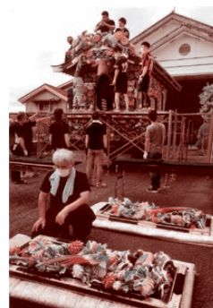
【特選 文化遺産を守る】