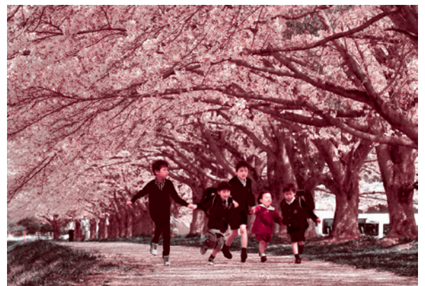
【推薦 入学式へ行こう】