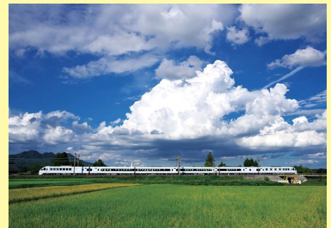
2023 特選 鹿沼市観光協会会長賞「夏のスペーシア号」