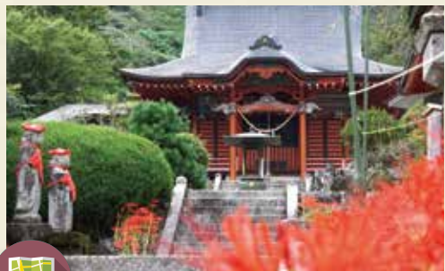
MAP >>>> E-5 常楽寺

日本武尊を祀る神社。江戸時代には「天狗使い」として有名で、嵐除け・火防などの災難除けに靈驗あらたか。