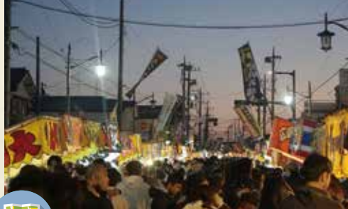
MAP >>>> K-9 花市 1月第4土曜日

激しく燃え上がった護摩の炎がおさまると、読経が響く中、 修験者や参拝者が素足でその上を歩き、厄除けを祈願します。 (参加御祈禱料 有料)