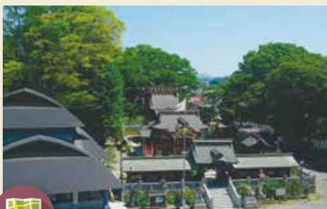
MAP >>>> J-8 今宮神社

春は桜、秋に彼岸花の名所として知られる常楽寺。運が良ければ彼岸花とそばの花を同時に見ることができます。境内に名医録事法眼(中野智元)を祀っていることから、このお堂が「録事尊」と呼ばれ、毎年2月11日には大祭が行われます。