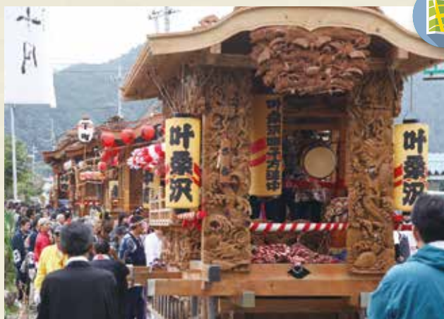
MAP >>>> N-11 口栗野神社秋季例大祭 10月第1土曜日・日曜日(2年に一度開催)

延長年間に創立された神社で、明治5年に口栗野神社と改称しました。氏子町11町のうち7町が屋台を持っていて隔年で巡行するほか、神前で奉納囃子を行います。