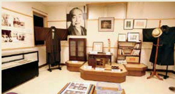
MAP >>>> G-5 千葉県三記念館

明治末期から大正初期にかけて造営された日本庭園。当時「鹿沼三名園」と呼ばれたもののうち、現存する最後の庭園です。貸切利用やコワーキングスペースとしての利用が可能です。