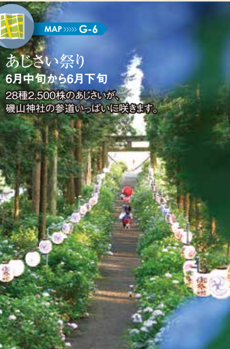
MAP >>>> G-6 あじさい祭り 6月中旬から6月下旬 28種2,500株のあじさいが、磯山神社の参道いっぱいに咲きます。

全国一のさつきの祭典。約1千種類、1万本以上のさつきの花を楽しめるほか、ガーデニング全般の情報を用意しています。