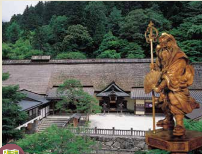
MAP >>>> C-2 古峯神社

日本武尊を祀る神社。江戸時代には「天狗使い」として有名で、嵐除け・火防などの災難除けに靈驗あらたか。