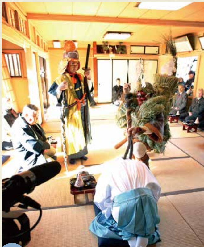
MAP >>>> C-4 ほうこうし ぎょうはんしき 発光路の強飯式 1月3日

地方の日常は、都市の方にとって新鮮に見えることでしょう。 「ハレの日」ともなればそこにはたくさんの刺激が隠れています。 「しきたり」や日々の営みから生まれた数々の行事に息づく、 鹿沼の心をお楽しみください。