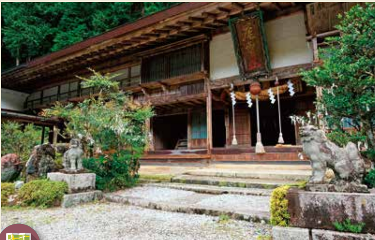
MAP >>>> D-4 賀蘇山神社

奈良時代に日光を開山した勝道上人が創建したと伝えられる神社。杉や千本かつらなどの天然記念物もあり、山岳信仰の名残を感じることができます。