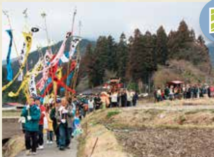
MAP >>>> F-2 板荷のアンバ様 3月第1土・日曜日

末広通りを中心に約1.1kmにわたって約300店もの縁起物や飲食の露店が軒を連ねる北関東でも有数の市です。