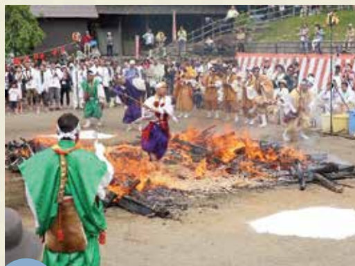
MAP >>>> D-2 金剛山火渡り修行 5月最終日曜日

妙見神社の当番引継ぎの際に行われる行事。山伏と強力が新旧の当番や来賓、氏子に厳しく、時にユーモラスな口上を述べ、高盛飯を強いた後、責め棒で首根を押さえて祝います。(国指定重要無形民俗文化財)