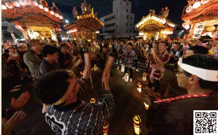
MAP >>>> G-4・J-8 鹿沼秋まつり 10月第2土・日曜日

横山町の生子神社で、子どもの健やかな成長を祈願して行われます。(市指定無形民俗文化財・国選択無形民俗文化財)