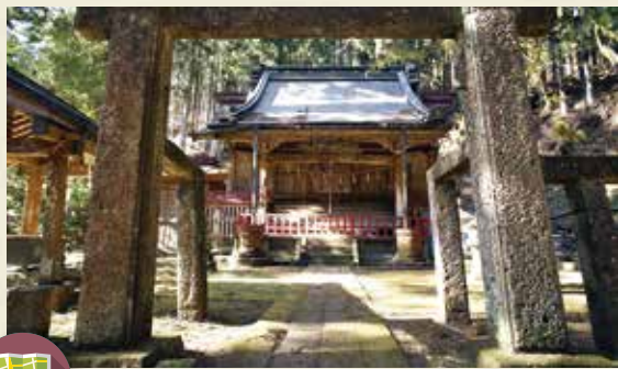
MAP >>>> D-3 加蘇山神社

奈良時代に日光を開山した勝道上人が創建したと伝えられる神社。杉や千本かつらなどの天然記念物もあり、山岳信仰の名残を感じることができます。