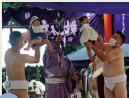
MAP >>>> G-5