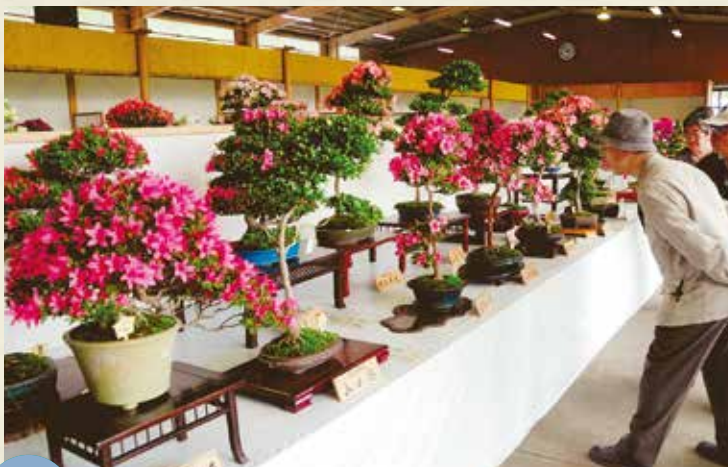
MAP >>>> G-5 鹿沼さつき祭り 5月第4土曜日から10日間

アンバ様の神輿が板荷地区の家々を回り、家内安全を祈願。同行する大天狗・小天狗は悪魔を払います。