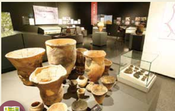
MAP >>>> K-8 文化活動交流館 (郷土資料展示室)

大正、昭和を代表する児童文学者千葉県三は、22歳で上京するまでの15年を楡木で過ごしました。「村童もの」と呼ばれる作品には、楡木地区を舞台にしたものが数多く見られます。