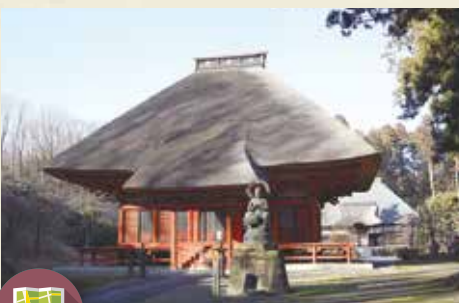
MAP >>>> G-6 東高野山 医王寺

国の正式な記録「日本三代実録」の878年の条に記された社。境内には宿坊、遥拝殿、大杉切株などがあり、例大祭には関白流獅子舞が奉納されます。