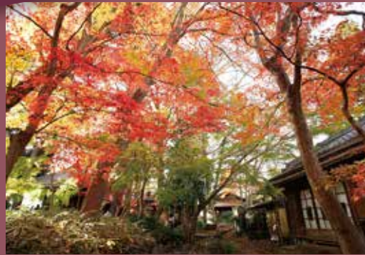
掬翠園 きくすいえん

明治末期から大正初期にかけて造営された日本庭園。当時「鹿沼三名園」と呼ばれたもののうち、現存する最後の庭園です。貸切利用やコワーキングスペースとしての利用が可能です。