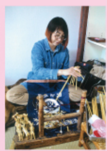
2025 特選 鹿沼市観光協会会長賞「きびから織工」