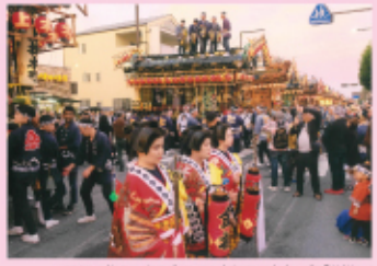
2025 特賞 鹿沼秋まつり実行委員会会長賞「勢揃い」