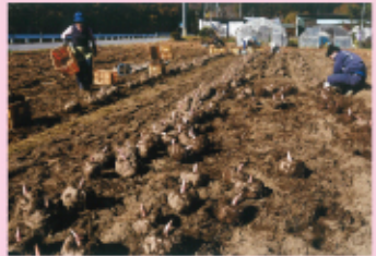
2025 準賞 鹿沼市長賞「秋の大収穫」

☆お問い合わせ （一社）鹿沼市観光協会 TEL0289-60-6070 FAX0289-62-5666 ホームページ： https://kanuma-kanko.jp/ E-mail： kanuma-photo@bc9.ne.jp 〒322-0052 栃木県鹿沼市銀座1-1870-1（厩台のまち中央公園内） ◎休園日：月曜（祝日の場合は翌日）・祝日の翌日・年末年始（12月28日～1月4日）